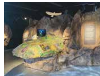
Maison de la Réserve Naturelle, nouvelle muséographie interactive animée par FNE Loire